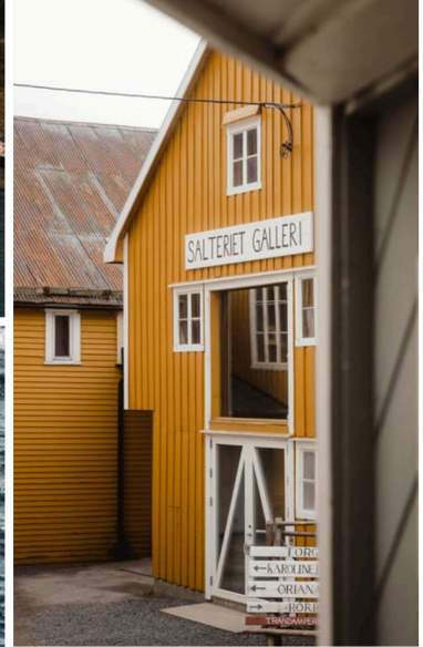
GÖMT I DALEN. Nusfjord kallas för "Lofotens dolda pärla". Fiskeläget med anor från 400-talet f.Kr. ägs i dag av familjen Krefting som driver Nusfjord Village & Resort.

Naturupplevelse och exklusivt boende förenas med fotokonst i Nusfjord, en av Lofotens äldsta och bäst bevarade fiskebyar.