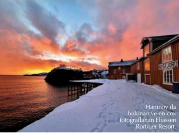
Hamnøy da bulunan ve en çok fotoğraflanan Eliassen Rorbuer Resort.

Bölgedeki outdoor aktivitelerinden biri de kayaking.