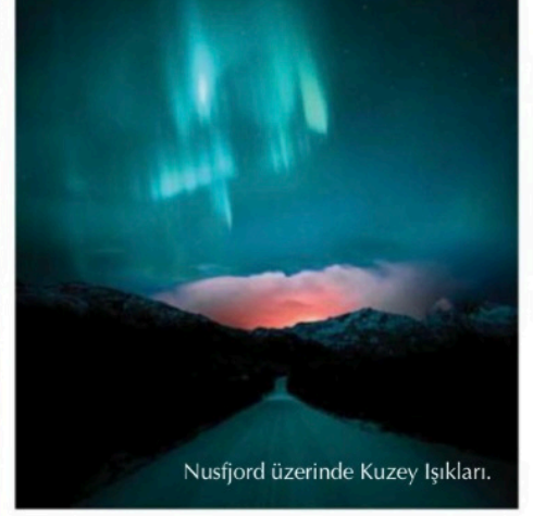
Nusfjord üzerinde Kuzey Işıkları.