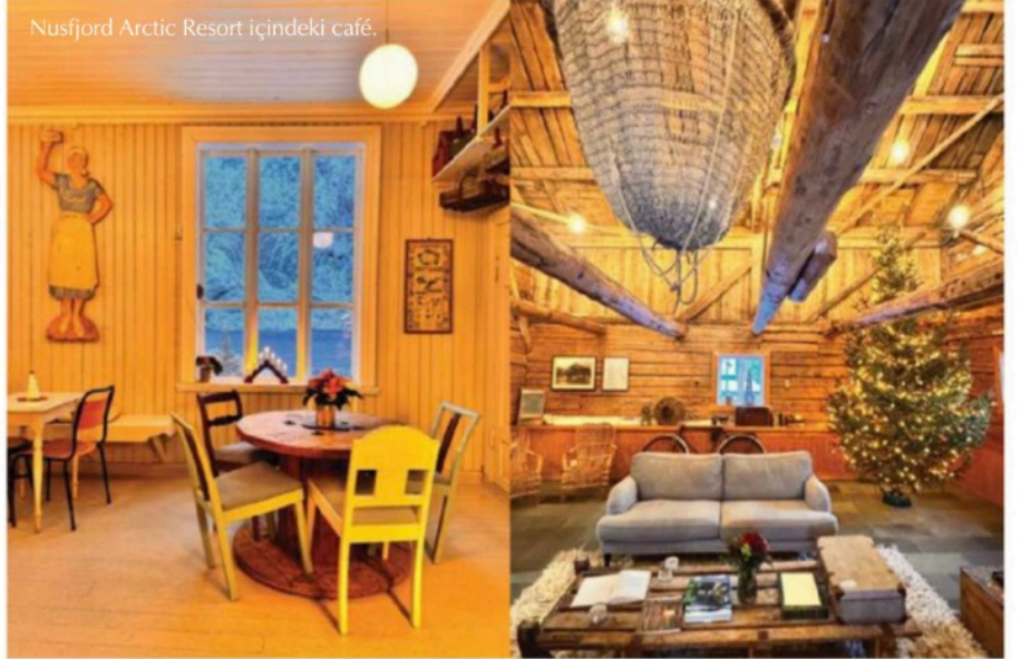
Nusfjord Arctic Resort içindeki café.

manzarası ile Hamnøy Bridge (en ünlü Lofoten manzarası için) ve en ünlü köyü Rein. Köprülerle birbirine bağlanan birkaç küçük adadan oluşan Reine, Norveç'te rorbu adı verilen balıkçı kulübeleri ile ünlü. Rorbu, normalde balıkçı köylerinde bulunan ve balıkçılar tarafından kullanılan, Norveç'te geleneksel bir mevsimlik ev türü. Ancak şimdilerde daha çok turistleri ağırlamak üzere kullanılıyor. Binalar yapısal olarak karada dururken bir ucu gemilere kolay ulaşım sağlaması için direklerle suyun içinde bulunuyor. Adaların en güney noktası ise A köyü. Tüm adaları birbirine bağlayan E10 otoyolundan kuzeye ve güneye giderek dağlarla denizen birleştiği fiyortlarda eşsiz manzaralar izlemek mümkün. Hava iyiye kayak, bot turları veya rehber eşliğinde dağlara tırmanış yapabileceğiniz en doğru aktiviteler. Biraz daha şehir hayatını sevenler içinse kuzeyde bulunan Henningvaer şehrini öneririm.