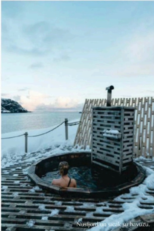
Nusfjord'un sıcak su havuzu.