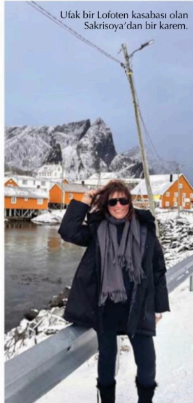
Ufak bir Lofoten kasabası olan Sakrisøya'dan bir karem.

L ofoten Adaları, Norveç Nordland'a bağlı bir takımada ve geleneksel bölge olarak biliniyor. Vestvågøy, Moskenesøya, Gimsøya, Austvågøya ve Flakstadøya'dan oluşan Lofoten Adaları dağları, zirveleri, açık denizi, korunaklı koyları ve plajları ile kendine özgü bir manzaraya sahip. Kuzey Kutup Dairesi'nin hemen üzerinde, 68. kuzey paralelinde yer alan Lofoten, yaz aylarında Geceyarısı Güneşi'nin tadını çıkarırken Eylül'den Nisan'a kadar da büyültü Kuzey Işıkları'na tanıklık ediyor.