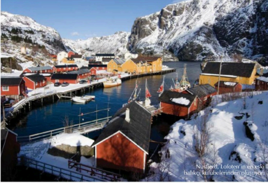
Nusfjord, Lofoten'in en eski balıkçı kulübelerinden oluşuyor.