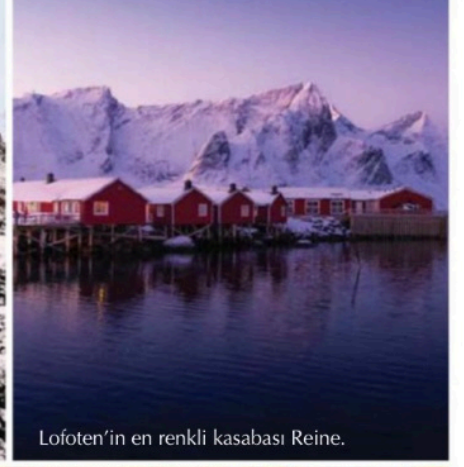
Lofoten'in en renkli kasabası Reine.